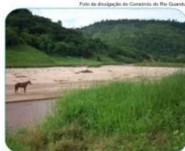
Córregos assoreados estão entre os problemas enfrentados pela Bacia do Guandu.

Cada projeto receberá o auxílio de aproximadamente R$ 100 mil, sendo que 50% desse recurso devem ser destinados ao plantio de mudas de árvores. Além disso, deste total, 5% deve ser disponibilizado na forma de contrapartida.